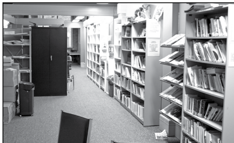
Les locaux d'Alpha-Toronto sont situés au 90 rue Richmond Est