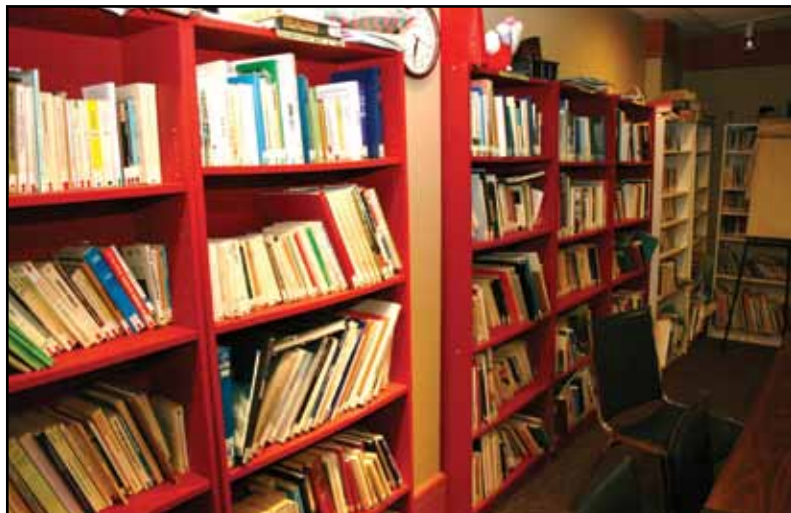
La bibliothèque Marie-Luce-Leblanc d'Alpha-Toronto offre un éventail surprenant de ressources littéraires.