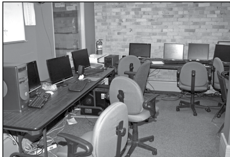
Le coin de l'informatique dans les locaux d'Alpha-Toronto

les autres agences, d'avoir plus d'argent pour pouvoir offrir des avantages sociaux décentes à ses employés. Avec une clientèle qui dépasse toujours la cible ajustée à 67 clients par le ministère de la Formation et des Collèges et Universités avec une centaine d'apprenants à Toronto, Renaud Saint-Cyr et son équipe peuvent avoir le sentiment du devoir accompli.